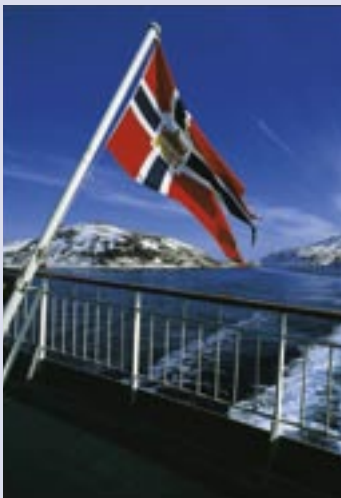
Ausflugsfahrt auf dem Tysfjord