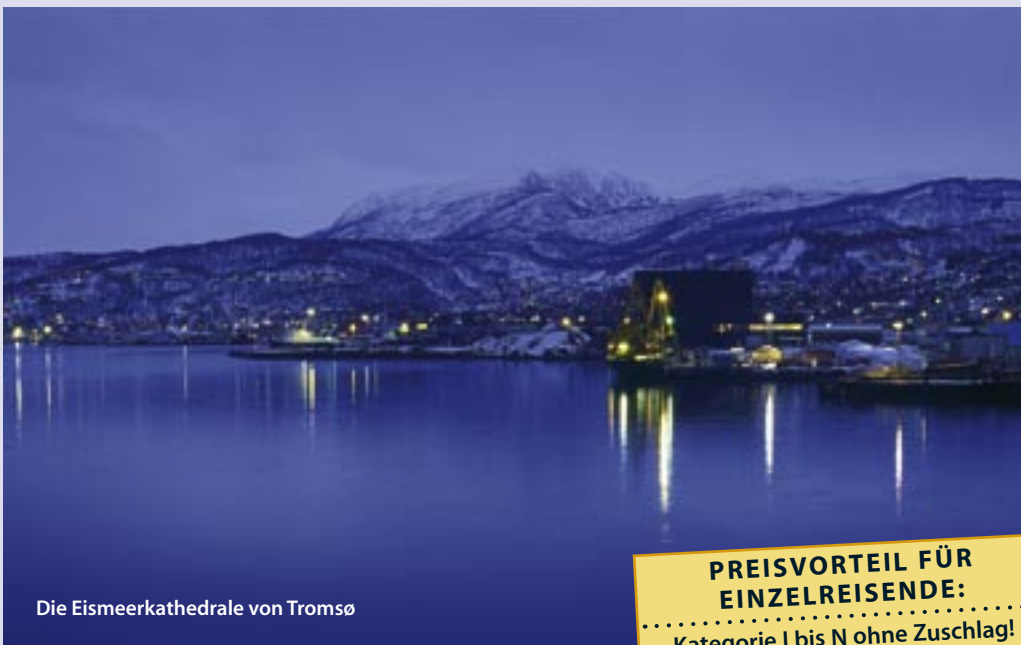
Die Eismeerkerchrale von Tromsø

PREISVORTEIL FÜR EINZELREISENDE: Kategorie I bis N ohne Zuschlag!